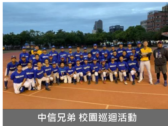
中信兄弟 校園巡迴活動