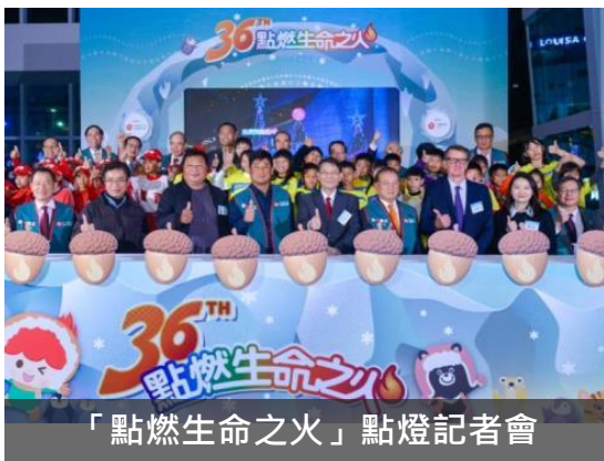
「點燃生命之火」點燈記者會