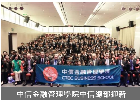
中信金融管理學院中信總部迎新