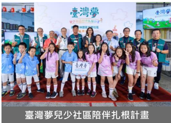
臺灣夢兒少社區陪伴扎根計畫