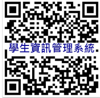
學生資訊管理系統