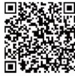
台新學雜費入口網