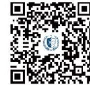
申請免修英文標準