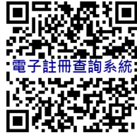
電子註冊查詢系統