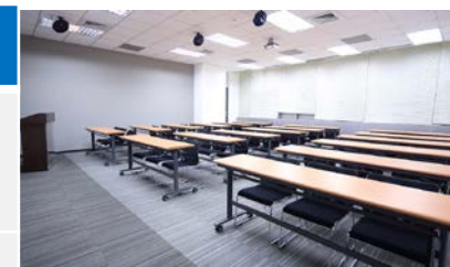
集思北科大會議中心